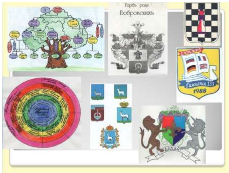
Материал по теме «Геральдика», рассказы о родных, Родословия, Семейные древа, эскизы-проекты гербов, выполненные обучающимися прошлых лет.